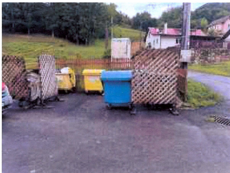
POHĽAD NA RIEŠENÉ Miesto